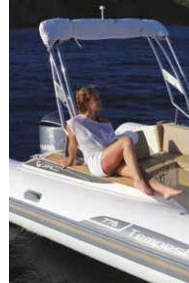
Corrimano inox di serie da Settembre 2016/CS handrail STD from Sept. 2016